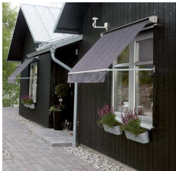
Februari 2019 Karpe Form .se