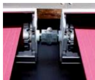
Sammankoppling för gemensam motordrivning