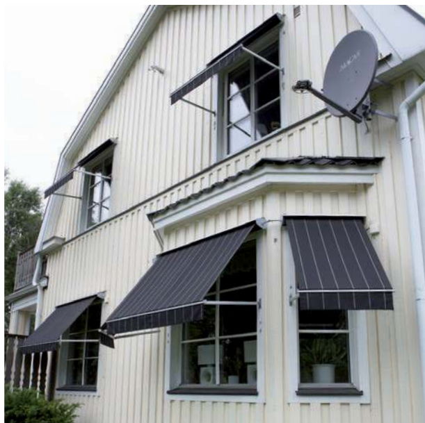
Februari 2019 Karpe Form .se