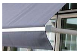
Rak front med kapp

Februari 2019 Karpe-Form .se Framsidesbild från Sandatex.