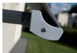
Rundad front utan kapp